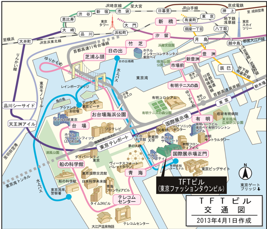
TFTビル 交通図 2013年4月1日作成